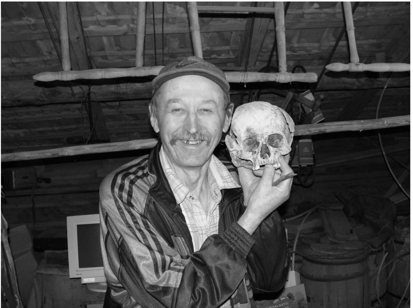
Taipaleenjoen matkalla vuonna 1990 silmitetty sodan muisto Terenttilän viitostukikohdasta